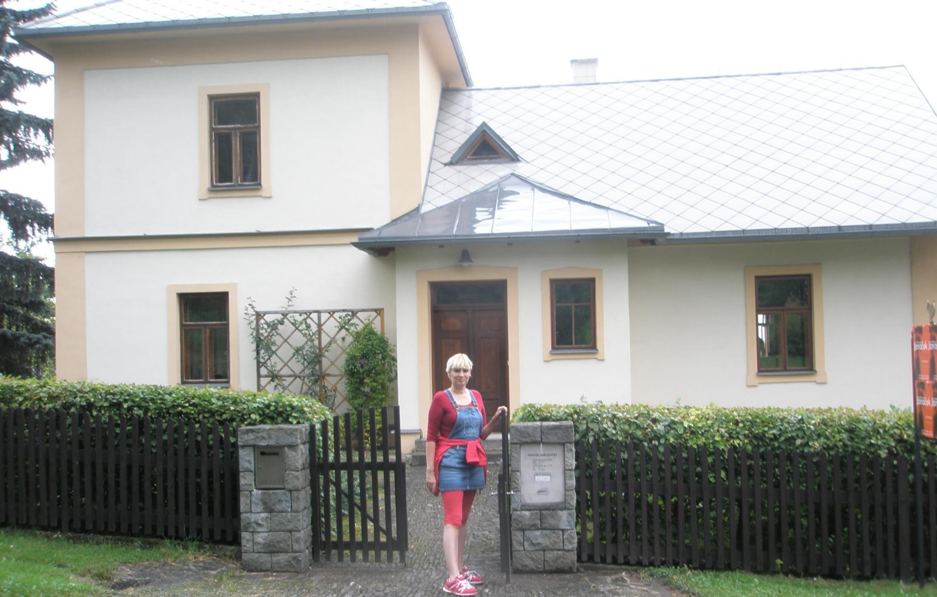
Rodný dům Leoše Janáčka